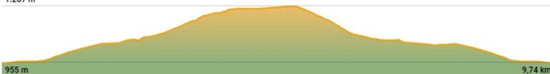
TABLA TÉCNICA UTRILLAS CARBÓN TRAIL "DESAFÍO MINERO" BY FARTLECK SPORT